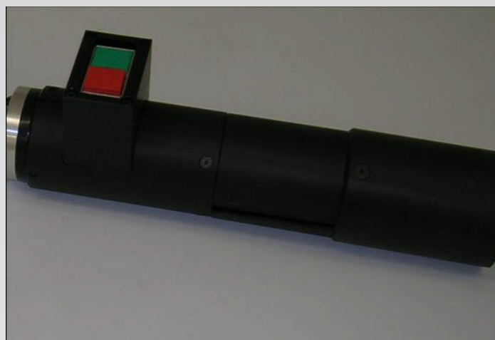
Vista del cuerpo principal con los botones de mando